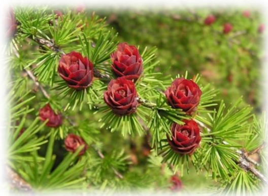
Лиственница сибирская Larix sibirica

Ель колючая характеризуется поздним началом вегетации, малотребовательна к теплу, зимо-и заморозкоустойчива, сравнительно засухоустойчива, наиболее дымо-и газостойка. По сравнению с другими хвойными породами в отношении почв неприхотлива. Особой устойчивостью в условиях промышленной среды отличается ель колючая серебристой формы ( P. pungens f. argentea ), часто применяемая для озеленения городов России.