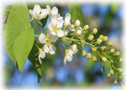
Черёмуха обыкновенная, птичья Prunus avium