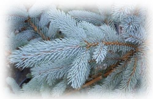
Ель колючая Picea pungens

Естественный ареал ели европейской расположен на северо-востоке европейской части России, в Тюменской области встречаются единичные экземпляры.