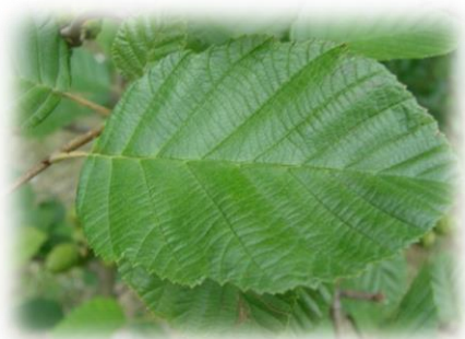
Ольха серая (белая) Alnus incana

Ольха черная встречается в Исетском и Тюменском районах юга Тюменской области.