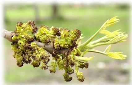
Ясень пенсильванский Fraxinus pennsylvanica

Растёт быстро, возобновляется порослью от пня. Светолюбив, не газоустойчив, не любит уплотнения почвы. В озеленении используется для создания аллей, групп, одиночных посадок.