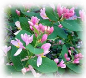
Жимолость татарская Lonicera tatarica