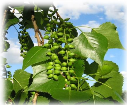
Тополь чёрный (осокорь) Populus nigra

На юге тюменской области тополь белый встречается небольшими группами преимущественно в поймах рек, иногда входит в состав разреженных пойменных лесов в Абатском, Викуловском, Ишимском, Исетском, Заодоуковском, Казанском, Тюменском, Упоровском и Ялуторовском районах.