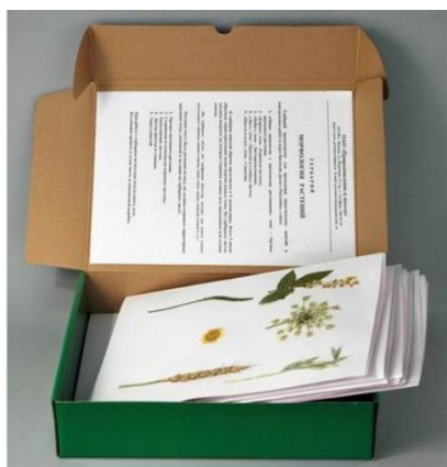
Рис. 3 Коробка для хранения гербария