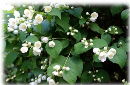
Чубушник Philadelphus семейство Гортензиевые ( Hydrangeaceae )

Плод – коробочка. Продолжительность жизни – 30-50 лет. Устойчива в городских условиях. Светолюбива, хотя и выносит небольшое затенение. Растет быстро. Размножается семенами и черенками.