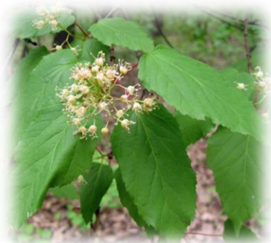
Клён татарский, черноклён, неклён Acer tataricum

светолюбив, жаростоек, нетребователен к плодородию почвы, хорошо выносит городские условия, очень быстро растет в молодости, недолговечен (80 лет, а в уличных посадках не более 30 лет). Даёт обильный самосев, который часто вырастает в самых неподходящих местах, поросль от пня. В городских посадках желательно оставлять только мужские растения. Аллелопат, подавляет развитие других растений, включая травянистые.