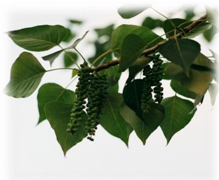
Тополь бальзамический Populus balsamifera

На юге Тюменской области встречается во всех районах, кроме Голышмановского, Омутинского, Сладковского, Армизонского и Бердюжского.