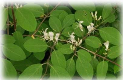
Жимолость обыкновенная Lonicera xylosteum

В естественных условиях произрастает в соседних Курганской и Омской областях, в Тюменской области повсеместно в озеленении.