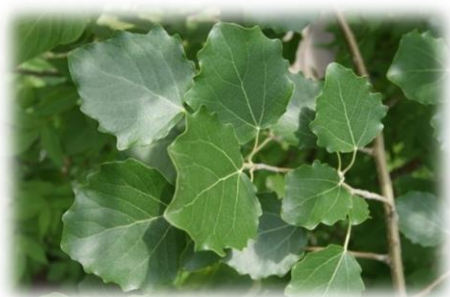
Тополь дрожащий, осина Populus tremula

Дерево высотой 25-30 м, до 1 м в диаметре. Крона округлая, ствол цилиндрический колонновидный, кора зеленовато-серая. Листья округлые (в кроне дерева), на длинных черешках, с пальчатым жилкованием и городчато-зубчатым краем. На порослевых побегах листья крупнее, треугольно-яйцевидные с заострённой вершинкой. Осина двудомна. Цветочные почки вскрываются в январе, но цветёт в марте – мае, до распускания листьев. Соцветие сережка. Деревья с мужскими сережками имеют более крупную сережку в начале цветения и более длинную – в конце цветения, чем сережки на женских деревьях. Мужские сережки образуют очень много пыльцы, женские сережки – семян. Семена имеют пучок волосков, за счет которых семена распространяются ветром, иногда сережка опадает целиком и семена рассыпаются на почве. Семена, достигшие благоприятных условий, способны прорасти через несколько часов.