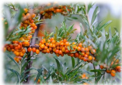
Облепиха крушиновая Hippophae rhamnoides