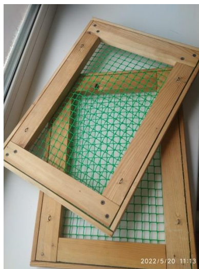
Рис. 2 Варианты ботанических прессов