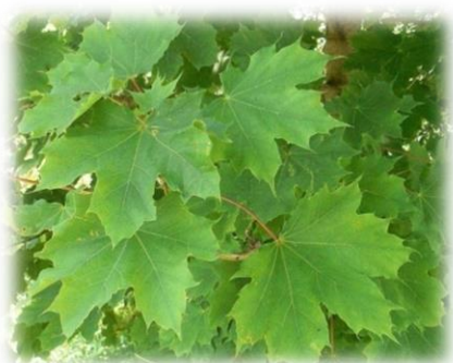
Клён остролистный Acer platanoides

Дерево высотой до 5-7 м, до 20 см в диаметре, часто крупный кустарник. Кора гладкая, серая, побеги тонкие, красновато-бурые. Листья на удлиненных побегах 3-лопастные, с вытянутой, продолговато-яйцевидной средней лопастью, блестящие, темно-зеленые. Листья плодущих побегов почти цельные или трехлопастные , но средняя лопасть у них не оттянута, осенью приобретают малиново-красную окраску. Цветёт в конце мая – начале июня при полном облиствлении. Соцветие яйцевидная метелка, цветки желтоватого цвета. Крылья плода расходятся под очень острым углом и часто находят друг на друга. Медонос. Светолюбив, морозостоек, малотребователен к плодородию почвы, растет быстро, хорошо переносит обрезку.