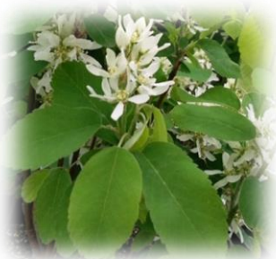
Ирга круглолистная Amelanchier rotundifolia

Светолюбива, мирится с некоторым затенением, участвуя во втором ярусе и в подлеске. Предпочитает влажные плодородные почвы. Цветёт и плодоносит с 10-12 лет. Даёт поросль от пня и корневые отпрыски.