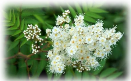
Рябинник рябинолистный Sorbaria sorbifolia

Кустарник высотой 2-3 м, листья непарно-перистосложные, состоят из 13-23 ланцетных или яйцевидно-ланцетных листочков, листочки длинно-заострённые, пильчатые по краю. Белые цветки собраны в пирамидальные метёлки длиной 25 см и более.