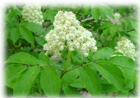
Бузина сибирская Sambucus sibirica

В Тюменской области растет небольшими группами или одиночно по поймам рек, на полянах среди смешанных и лиственных лесов во всех районах ХМАО и ЮТО.