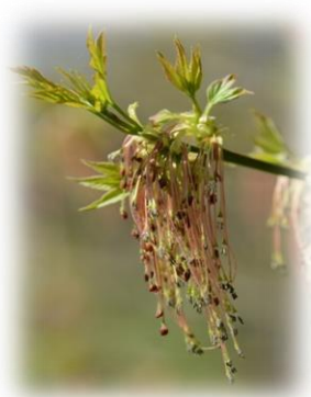
Клён ясенелистный (американский) Acer negundo

Ранее эта триба рассматривалась в ранге одноимённого семейства Кленовые Aceraceae . Все виды кленов являются интродуцентами для нашей зоны.