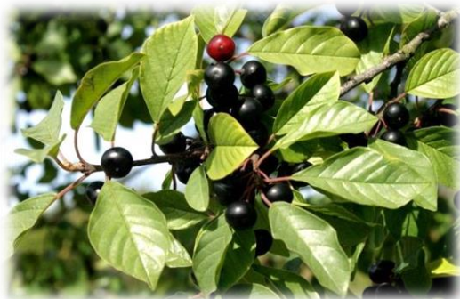
Крушина ломкая (ольховидная) Frangula alnus

Дерево или кустарник высотой до 3-5 м. Листья очередные, эллиптические, с 6-12 парами четких параллельных жилок. Цветки обоеполые, собраны в пазушные пучки (2-10 шт.). Плод – сочный перинарий. Плод черный, сочный, круглый (3 косточки), несъедобен. Теневынослива, морозостойка, зимостойка, растёт на почвах, обладающих достаточной влажностью. Растёт медленно. Размножается семенами, отводками, корневыми отпрысками, даёт поросль от пня. Ценный почвоулучшающий кустарник. Используется в качестве опушечного растения, в пристенных и оградных посадках и стриженных живых изгородях.