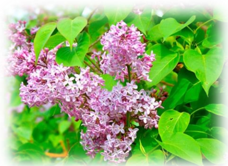
Сирень обыкновенная Syringa vulgaris

В культуре встречается также ясень американский ( Fraxinus americana ), отличается более мелкой крылаткой и зубчатыми по краю листочками.