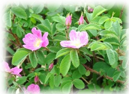
Роза иглистая, шиповник Rosa acicularis