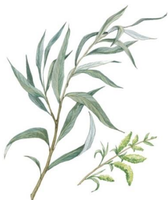
Ива белая (ветла) Salix alba

Дерево до 25 м высотой, до 3 м в диаметре. Крона широкая, нередко плакучая. Кора тёмно-серая, с глубокими трещинами. Молодые побеги серебристо-опушённые. Листья ланцетные или линейно-ланцетные до 10 см, заострённые , мелкопильчатые, весной серебристо-шелковистые с обеих сторон, позже только снизу. Почки покрыты одной чешуйкой. Двудомное растение. Соцветия – однополые сережки. Цветёт одновременно с распусканием листьев, в апреле – мае. Цветки с нектарниками (все ивы медоносы), но без околоцветников, опыляются насекомыми. Пыльца липкая. Плод раскрывается двумя створками. Семена с пучком волосков, распространяются ветром, попав во влажную среду, прорастают через несколько часов. Растёт по берегам водоёмов, поймам, нетребовательна к богатству почв. Используется в озеленении, формируется.