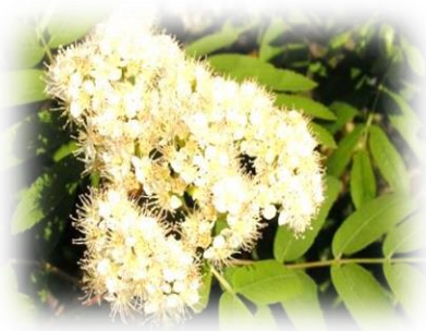
Рябина обыкновенная Sorbus aucuparia