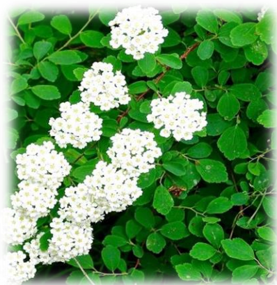
Спирея городчатая Spirea crenata

Кустарник высотой до 1,5 м с прямостоящими ветвями. Листья обратно-яйцевидные или эллиптические, цельнокрайние, с 3 зубцами на верхинке . Цветки белые , собраны в щитки на коротких облиственных веточках. Цветёт в первой половине июня. Морозостойка, хорошо переносит засуху, при недостатке влаги образует карликовые кустики с мелкими листьями. Размножается семенами и зелеными черенками. Рекомендуется в озеленении, формируется.