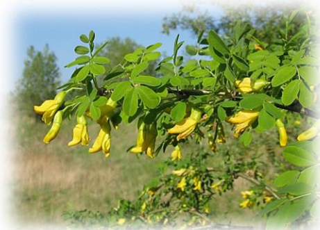
Карагана древовидная (желтая акация) Caragana arborescens