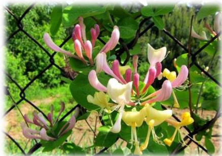
Жимолость козья (каприфоль)

Кустарник высотой до 3 м. Побеги опушённые. Почки без чешуй. Листья овальные, опушённые, морщинистые, мелкозубчатые. Цветки беловато-кремовые, мелкие, все фертильные (репродуктивные). Цветет в начале июня. Плоды чёрные (в начале красные), приплюснутые, до 8 мм. Засухоустойчива, устойчива в городских условиях, теневынослива, морозостойка, растет быстро, активно распространяется самосевом.