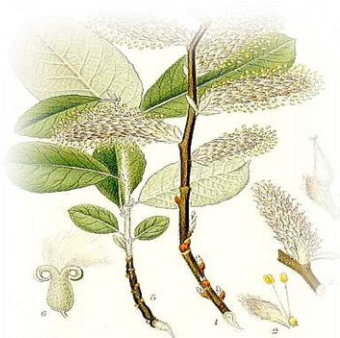
Ива пепельная Salix cinerea

Кустарник высотой 5-6 м. Ветви длинные, тонкие. Листья узко-или линейно-ланцетные, нижний край листовой пластинки завёрнут вниз , цельнокрайние или волнисто-выемчатые, сверху тёмно-зелёные, голые или опушённые, снизу шелковистое опушение вдоль жилок второго порядка. Цветёт в марте – мае. Растёт быстро, но к 30 годам завершает развитие и отмирает. В Тюменской области встречается почти повсеместно по речным побережьям и долинным лугам.