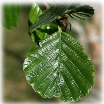
Ольха чёрная (клейкая) Alnus glutinosa

Ряд видов берёз являются важнейшими лесообразующими породами, с осинкой они образуют мелколиственные леса по всей лесной зоне РФ. В Тюменской области распространена во всех районах и даже встречается в лесотундровой зоне ЯНАО.