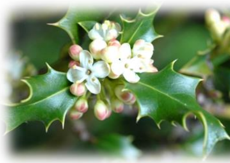
Падуб остролистный, Ilex aquifolium