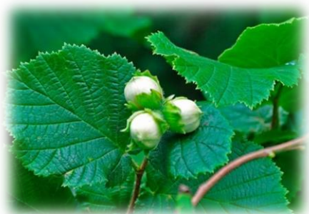
Лещина обыкновенная, орешник, лесной орех Corylus avellana

Нижнетавдинском, Сорокинском, Тобольском, Тюменском, Уватском, Юргинском, Ялуторовском и Ярковском районах.