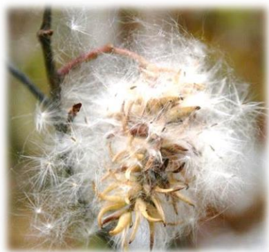
Ива пятитычинковая (лавролистная, чернотал, чернолоз) Salix pentandra

В Тюменской области произрастает повсеместно в поймах рек, на лугах, заболоченных участках, встречается одиночно или в составе ивняковых зарослей.