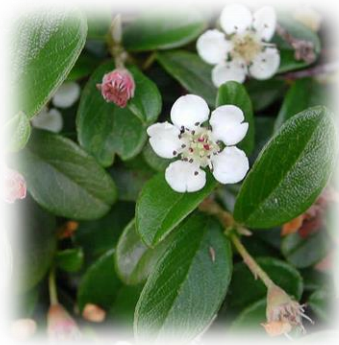
Кизильник черноплодный Cotoneaster melanocarpus