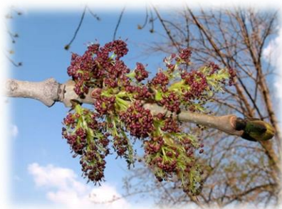
Ясень обыкновенный Fraxinus excelsior