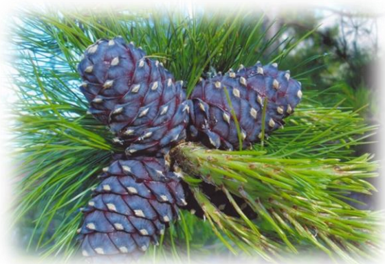
Сосна кедровая сибирская, или кедр сибирский Pinus sibirica

В Тюменской области сосновые леса встречаются во всех районах ХМАО и юга области, в ЯНАО во всех районах кроме северных – Тазовского и Ямальского.