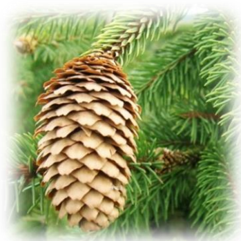
Ель европейская, или обыкновенная Picea abies

В Тюменской области еловые леса встречаются во всех районах ХМАО, на юге области в Вагайском, Викуловском, Нижне-Тавдинском, Тобольском, Тюменском, Уватском, Юргинском и Ярковском районах, в Ямало-Ненецком округе (далее – ЯНАО) не доходит до границы произрастания древесной растительности.