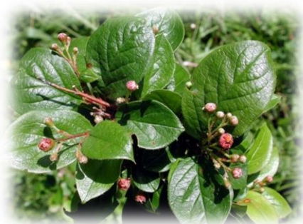
Кизильник блестящий Cotoneaster lucidus

красные. Цветки 12 мм в диаметре, по 12-30 в щитковидных соцветиях. Цветки белые или розоватые. Цветёт с конца мая до середины июня. Плоды шарообразные, чёрные, 6-10 мм, с 8 семенами. Плоды используются в пищу и в медицинских целях. К почвам неприхотлива, светолюбива, зимостойка, вредителями не повреждается. Хорошо переносит пересадку. Применяют в высоких плотных стриженных живых изгородях. Не оголяется снизу, декоративна насыщенной осенней окраской листвы.