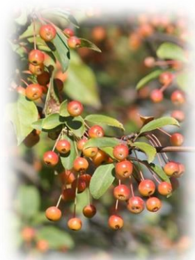
Яблоня лесная Malus sylvestris

Корневая система мощная, образует массу корневых отпрысков. Нетребовательна к почве, морозостойка, светолюбива. Также произрастает в Тюменской области повсеместно.