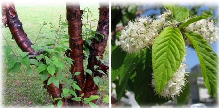
Черёмуха Маака Padus maackii

Используется в озеленении, размножается семенами и черенками.