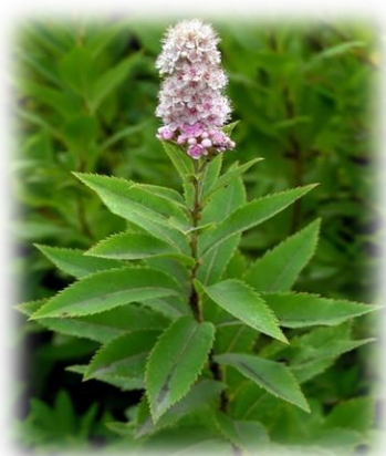
Спирея иволистная Spiraea salicifolia

Кустарник высотой до 1-2 м, с прямостоящими ветвями. Побеги гладкие, в молодости жёлто-коричневые, двулетние красно-бурые. Листья продолговато-эллиптические, 4-5,5 см длиной, с клиновидным основанием, на цветочных побегах цельнокрайние, на стерильных (обычно верхние) на вершине с немногими крупными зубцами , сверху зелёные, снизу светлее, по краю реснитчатые . Соцветия – сложные рыхлые щитки на концах коротких побегов. Цветки белые , цветёт в мае – июне. Морозо- и засухоустойчива. Газоустойчива. Переносит некоторое затенение. Образует заросли вместе с другими кустарниками на открытых сухих склонах по опушкам лесов. В культуре с 1789 года. Одна из самых распространённых спирей.