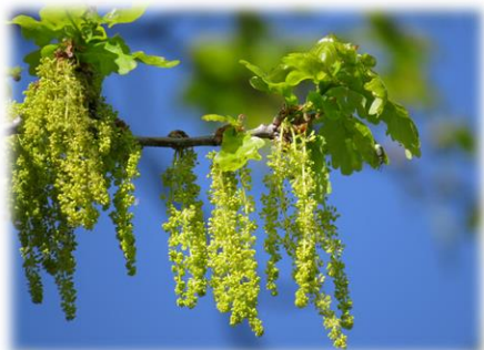
Дуб черешчатый Quercus robur