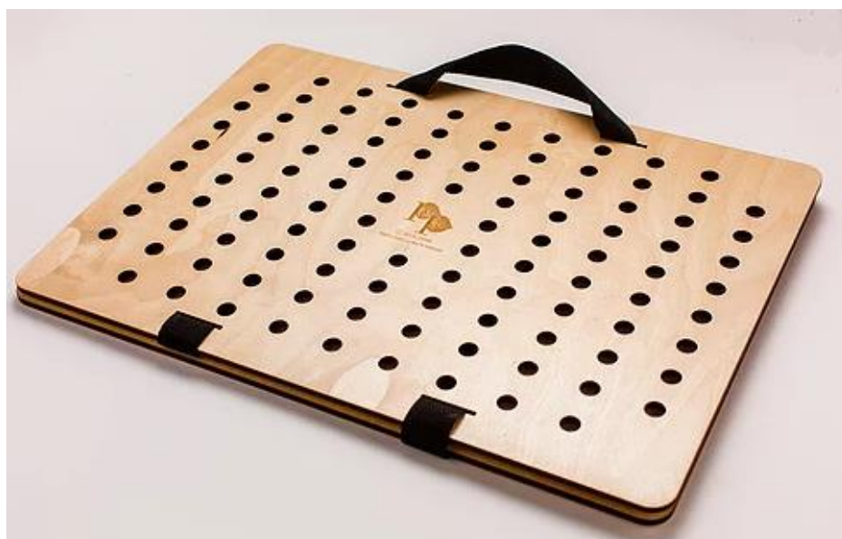
Рис. 1 Ботаническая папка для сбора растений