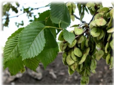
Вяз гладкий Ulmus laevis