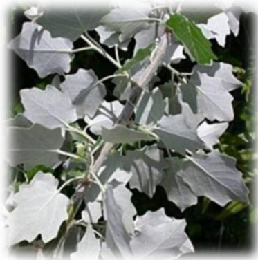
Тополь белый Populus alba

Дерево высотой до 30-40 м, до 2 м в диаметре с широкой раскидистой кроной. Кора серо-зелёная, гладкая, в старости – с глубокими трещинами. Молодые побеги, почки и нижняя сторона листьев беловойлочно-опушены . Листья на удлинённых и порослевых побегах пальчато-лопастные, на укороченных – округлые или овальные, с выемчато-зубчатым краем. Листья осенью опадают зелеными. Двудомное растение. Соцветия – однополые сережки. Цветет до распускания листьев в конце апреля – начале мая.