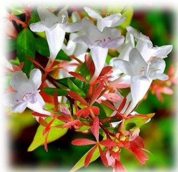
Абелия Abelia семейство Жимолостные ( Caprifoliacea )

В России часто этот кустарник неправильно называют жасмином за выраженный сладкий аромат цветков у некоторых видов чубушника. Растение с множеством небольших стволов, на поверхности которых находится серая кора, являющаяся достаточно тонкой. У молоденьких стеблей, как правило, кора окрашена в коричневый цвет и отслаивается. Листья 2-7 см, их форма зависит от вида и может быть яйцевидная, удлинённая либо широкояйцевидная. Формирование кистевидных соцветий происходит на верхушках молодых побегов. Цветки душистые и могут быть полумахровыми, простыми либо махровыми. Цветение продолжительное, 2-3 недели в июне. Плод представляет собой коробочку, имеющую трех–пятигранную форму. Дает сильную корневую поросль.