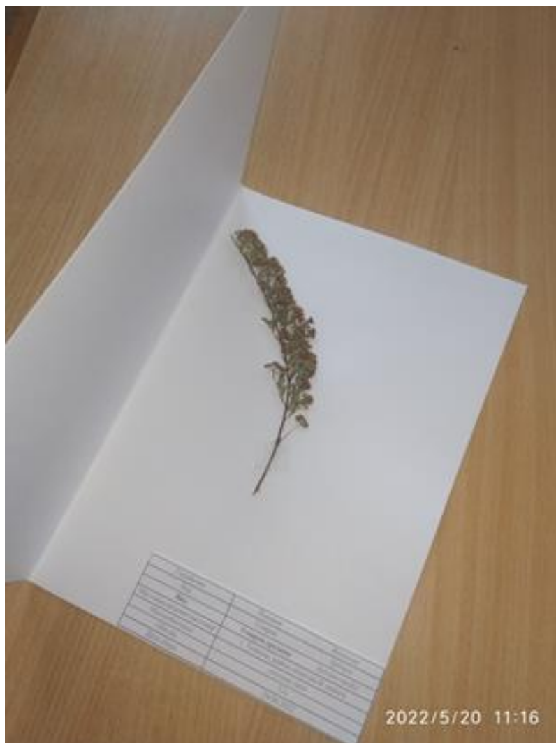
Рис. 4. Оформленный гербарный лист

Подбирают пластинку стекла, соответствующую размерам монтируемого материала. По размеру стекла вырезают картон. На картон ровным слоем (0,5-1 см) кладут вату, на нее – чисто протертое стекло. Все это помещают под гнет, и как только вата примнётся под тяжестью, на нее аккуратно переносят свежий срезанный побег (соцветие). После высыхания, края стекла и картона обклеивают окантовочным материалом.