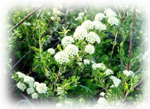
Спирея зверобоелистная Spireae hypericifolia

Кустарник высотой до 1,5 м с прямостоящими ветвями. Листья обратно-яйцевидные или эллиптические, цельнокрайние, с 3 зубцами на верхинке . Цветки белые , собраны в щитки на коротких облиственных веточках. Цветёт в первой половине июня. Морозостойка, хорошо переносит засуху, при недостатке влаги образует карликовые кустики с мелкими листьями. Размножается семенами и зелеными черенками. Рекомендуется в озеленении, формируется.