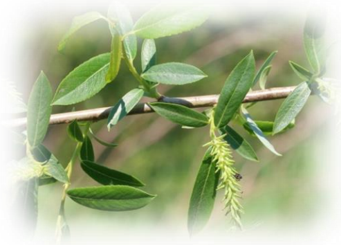
Ива трёхтычинковая (миндалелистная, лоза, тальник, белотал) Salix triandra

Высокий кустарник или небольшое дерево до 8-10 м. Ветви желтые тонкие, гибкие. У старых столов кора отслаивается пластинами, кора серая. Листья узколанцетные, яйцевидно-ланцетные, длиной 4-15 см, шириной 0,-- 3,5 см, заострённые, в основании округлые или клиновидные, железисто-пильчатые или зубчатые по краю, сверху тёмно-зелёные блестящие , снизу сизые. Прилистники почковидные, зубчатые, долго сохраняются. Цветёт в апреле – мае одновременно с распусканием листьев или чуть позже. Соцветия – однополые сережки, ароматные.