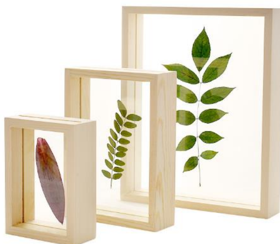
Рис. 5 Пример оформления выставочных гербариев под стекло