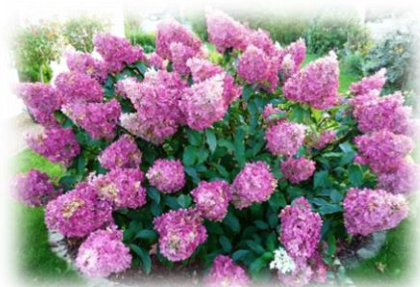
Гортензия метельчатая Hydrangea paniculata семейство Гортензиевые

Используется как декоративное растение и в озеленении, в группах, одиночных посадках и в живых стриженных изгородях.