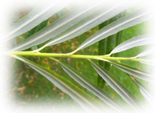
Ива корзиночная Salix viminalis

Кустарник высотой 5-6 м. Ветви длинные, тонкие. Листья узко-или линейно-ланцетные, нижний край листовой пластинки завёрнут вниз , цельнокрайние или волнисто-выемчатые, сверху тёмно-зелёные, голые или опушённые, снизу шелковистое опушение вдоль жилок второго порядка. Цветёт в марте – мае. Растёт быстро, но к 30 годам завершает развитие и отмирает. В Тюменской области встречается почти повсеместно по речным побережьям и долинным лугам.