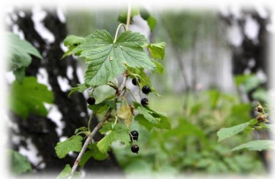
Смородина черная Ribes nigrum

Пряморастущий кустарник высотой до 2 м, все части которого имеют специфический запах, распространяемый смолистыми железками. Листья трех-, пятилопастные, крупные (до 10 см), с широкотреугольными острозубчатыми лопастями, железистые. Цветки с лилово-розовым оттенком, мелкие в длинных кистях. Цветет в начале весны. Плоды – ложные ягоды черного цвета, душистые, многосемянные, в верхней части ягоды сохраняются остатки чашечки. Быстрорастущий морозостойкий влаголюбивый и теневыносливый кустарник с огромным ареалом от лесотундровой зоны ЯНАО до южных районов ЮТО. Один из самых ценных ягодных кустарников, родоначальник большого количества культивируемых сортов.