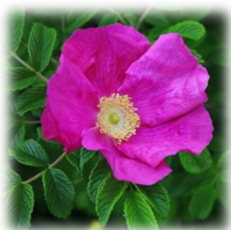
Роза морщинистая, шиповник Rosa rugosa

обратнойцевидные, с половины – городчато-зубчатые . Цветки белые в густом щитковидном соцветии , на коротких облиственных веточках, 1,5-5 см в диаметре, с 10-15 цветками, лепестки длиной 1,5-2 мм. Плод – сборная листовка из 5 плодолистиков, вскрывающихся по брюшному шву. Исключительно светлюбивое зимостойкое засухоустойчивое и нетребовательное к почвам растение аридных зон. Размножается семенами, в озеленении формируется.