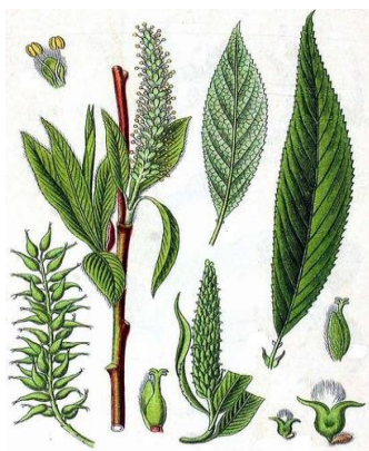
Ива ломкая (ракита) Salix fragilis

В Тюменской области произрастает Ханты-Мансийском районе ХМАО и во всех районах ЮТО.