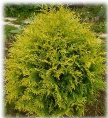
Туя западная Thuja occidentalis

Туя западная интродуцирована из Северной Америки в XVI веке. В ареале это дерево второго яруса темнохвойных лесов, до 20 м высотой, живет до 1000 лет. Кора ствола серая, гладкая, в старости продольно-волокнистая, отслаивающаяся узкими лентами. Ветви располагаются в горизонтальной плоскости, несколько повисшие, с двурядно-расположенными плоскими побегами. Хвоя темно-зеленая (зимой буреет), чешуевидная, до 4 мм длиной и 2 мм шириной, с выпуклой ароматической железкой, чешуйки снизу более светлые (но не белые), черепитчато налегают друг на друга; живет 2-3 года, осенью желтеет и в течение зимы опадает вместе с несущим побегом. Дерево однодомное, микро- и макростробилы образуются на концах побегов. Опыление происходит до начала весеннего роста в конце мая. Шишки яйцевидно-продолговатые, до 10-15 мм длиной, состоят из 3-4-6 пар накрест расположенных прямых мягких кожистых чешуй светло-коричневого цвета. Семена созревают и высыпаются из шишек осенью в год опыления. Семя вытянутое, с 2 узкими соломенно-желтыми крылышками по бокам. Дерево теневыносливое, зимостойкое, растет на суглинках нормальной влажности и среднего плодородия, устойчиво в условиях промышленной среды. В России широко используется в озеленении. Хорошо переносит обрезку и стрижку, страдает от навала снега.