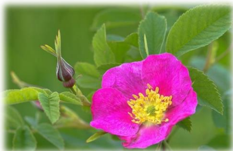
Роза коричная (майская) Rosa majalis

Характеризуется широкой экологической амплитудой, поэтому встречается повсеместно по всей Тюменской области.