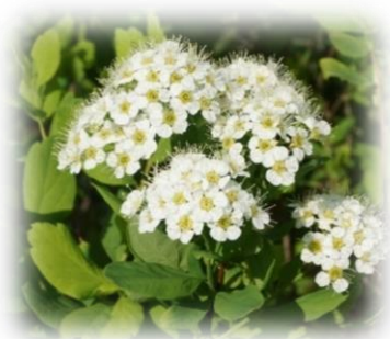
Спирея средняя Spiraea media

Быстрорастущий кустарник. Встречается по берегам рек и ручьёв, образует подлесок в виде сплошных зарослей в хвойных и смешанных лесах. Теневынослив, влаголюбив, выносит лёгкое заболачивание. Пересадку переносит легко, быстро укореняется. Первым ввёл в культуру рябинник в 18 веке Петербургский ботанический сад.