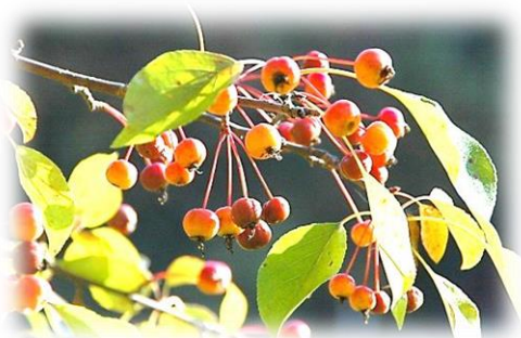
Яблоня ягодная (сибирская) Malus baccata

Дерево высотой до 10-12м, диаметром до 0,5 м. Крона раскидистая, шатровидная. Листья эллиптические, округлые, на вершине с коротким остриём. Цветёт одновременно с распусканием листьев. Цветки белые или розовые, в малоцветковых щитках , цветёт в мае. Плоды шаровидные, желтовато-зелёные, до 3 см, съедобные (после заморозков). Корневая система с хорошо развитым, глубоко уходящим в почву стержневым корнем. К почве средне требовательна. Засухоустойчива, переносит солонцеватость почвы, заболоченных мест избегает. Относительно теневынослива, но лучше растёт и развивается на опушках. Морозостойка. Растёт медленно, даёт поросль от пня. Наибольший интерес представляет как холодостойкий и сильнорослый подвой для культурных сортов яблонь.