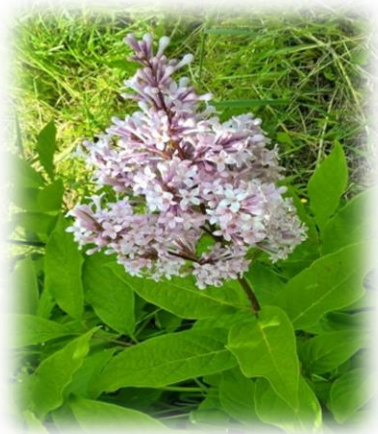
Сирень венгерская Syringa josikaea

Кустарник высотой до 8 м. Побег на вершине заканчивается тремя почками. Листья широкоэллиптические, морщинистые, голые, длиной до 12 см. Соцветие пирамидальная конечная метелка длиной до 22 см. Цветки длинно-трубчатые, мелкие, розовато-лиловые. Цветет на две недели позже, чем сирень обыкновенная и продолжительность цветения до 25 дней. Плод – 2-створчатая коробочка с 2 крылатыми семенами. Не дает отпрысков.