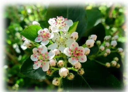
Арония черноплодная (рябина черноплодная) Aronia melanocarpa

Кустарник высотой до 2 м. Побеги опушённые, с многочисленными шипами и щетинками. Листочки (5-9 шт.) снизу опушены, морщинистые. Черешки опушены. Цветки одиночные, тёмно-пурпурно-карминовые, 6-12 см в диаметре. Цветёт с июня и до морозов. Гипантий тыквовидный . Плод цинородий – многосемянковый. В культуре повсеместно. Зимостойка, засухоустойчива, хорошо переносит условия города, не страдает от грибных заболеваний.