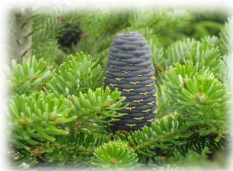
Пихта сибирская Abies sibirica

На ветвях растений образуются шишки – видоизмененные укороченные побеги, стробилы, выполняющие функции цветков. Растения семейства Сосновые это однодомные растения, но имеют разнополые шишки. Мужские шишки (пыльцевые, микростробилы) – это микроспорофиллы с микроспорангиями, в которых образуется пыльца. Пыльцевые шишки не крупные от 6 мм до 5-6 см длиной. Женские шишки (семенные, макростробилы) с двумя типами деревянистых чешуй: кроющие, сидящие по спирали на центральной оси и семенные – видоизмененные утолщения, сидящие в пазухах кроющихся чешуй и прикрывающие семена. У ели и пихты семенные шишки похожи, но у пихты они торчат вверх, а у ели повислые.