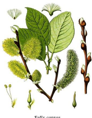
Ива козья (бредина) Salix caprea

Дерево высотой 15-20 м, до 1 м в диаметре, кора серая глубоко-трещиноватая, побеги ломкие у основания. Листья яйцевидно-продолговатые или яйцевидно-ланцетные с длиннозаострённой скошенной вершинкой и железисто-пильчатым краем . Двудомное растение. Соцветия – однополые сережки. Цветёт в мае одновременно с распусканием листьев. Растёт быстро, морозостойка, к почве более требовательна, чем ива белая. Лучшего развития достигает на глубоких, глинистых и влажных почвах. Интродуцент, используется в озеленении.