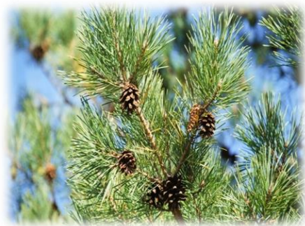
Сосна обыкновенная Pinus sylvestris