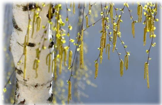
Берёза повислая Betula pendula