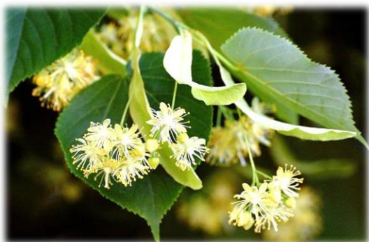
Липа мелколистная (или сердцевидная) Tilia cordata