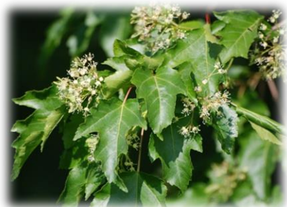
Клён приречный, Гиннала Acer ginnala

Дерево или крупный кустарник высотой до 10-12 м. Кора гладкая, почти черная, крона широкая, раскидистая. Листья яйцевидные, дваждыпильчатые по краю без лопастей или с двумя слабо намеченными лопастями у основания. Цветёт после распускания листьев. Цветки белые, собраны в конечные прямостоячие короткие пирамидальные метёлки. Крылатки малиново-красные, позже буреют, расположены под острым углом , слегка налегают друг на друга. Хороший медонос. Засухоустойчив, морозоустойчив, светолюбив, газоустойчив, умеренно требователен к плодородию почвы. Широко применяется в степном и полезащитном лесоразведении, в одиночных, групповых посадках, в живых изгородях.