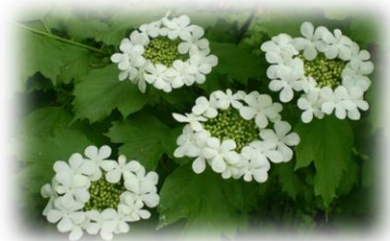
Калина обыкновенная Viburnum opulus