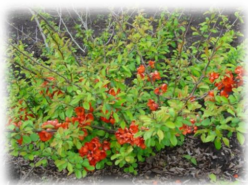
Хеномелес японский айва японская Chaenomeles japonica

Светолюбив – становится пышнее в солнечных местах, терпит небольшую полутень. К плодородию почвы нетребователен. Кустарник будет сгущаться, если ежегодно делать формирующую обрезку, сокращая все молодые побеги. Раз в несколько лет стоит выполнить омолаживающую обрезку, удаляя старые побеги. Существует множество сортов барбариса, отличающихся декоративными свойствами: формой куста, ягод, листьев, цветов и их окраской.