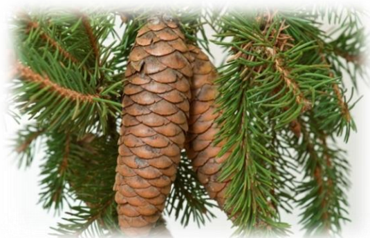
Ель сибирская Picea obovata

В Тюменской области пихтовые леса встречаются во всех районах Ханты-Мансийского автономного округа (далее – ХМАО), на юге области (далее – ЮТО) в Вагайском, Викуловском, Нижне-Тавдинском, Тобольском, Уватском и Ярковском районах (Лесной комплекс Тюменской области, https://gis.72to.ru/map/forestry/#65.787856,56.801752/9/23051 ).