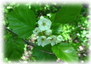
Боярышник сибирский (крово-красный) Crataegus sanguinea

вершиной. Цветёт после распускания листьев. Цветки белые, собраны по 4-8 в зонтиковидные соцветия. Плоды шаровидные до 1 см, на длинной плодоножке, жёлтые, терпкие, с горечью. Поверхностная корневая система. К почве малотребовательна, засухоустойчива, переносит длительные морозы до -50°C. Используется как подвой для культурных сортов. Переносит стрижку.