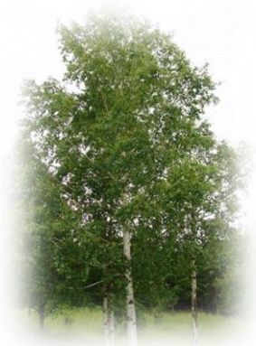
Берёза пушистая Betula pubescens