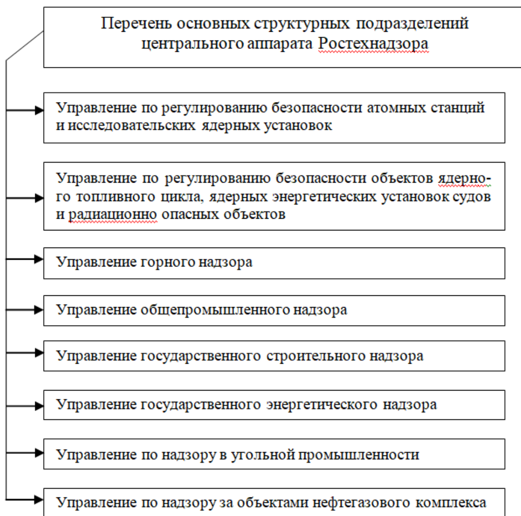
Рис. 3. - Перечень основных подразделений Ростехнадзора, отвечающих за надзор в области промышленной безопасности

Управление по регулированию безопасности объектов ядерного топливного цикла, ядерных энергетических установок судов и радиационно опасных объектов осуществляет государственный надзор за ядерной и радиационной безопасностью этих объектов.