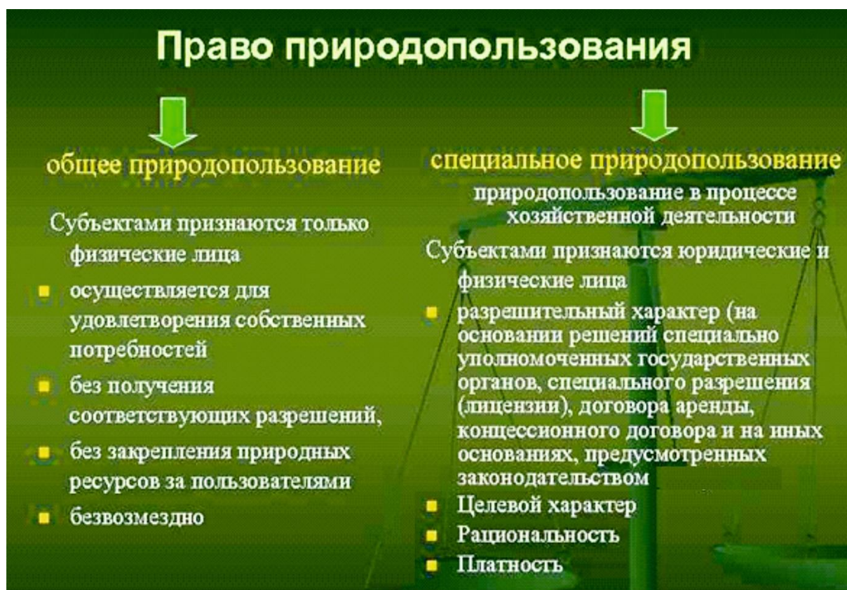
Рисунок 4.1 – Виды права природопользования

Право природопользования реализуется в двух видах (рисунок 4.1).