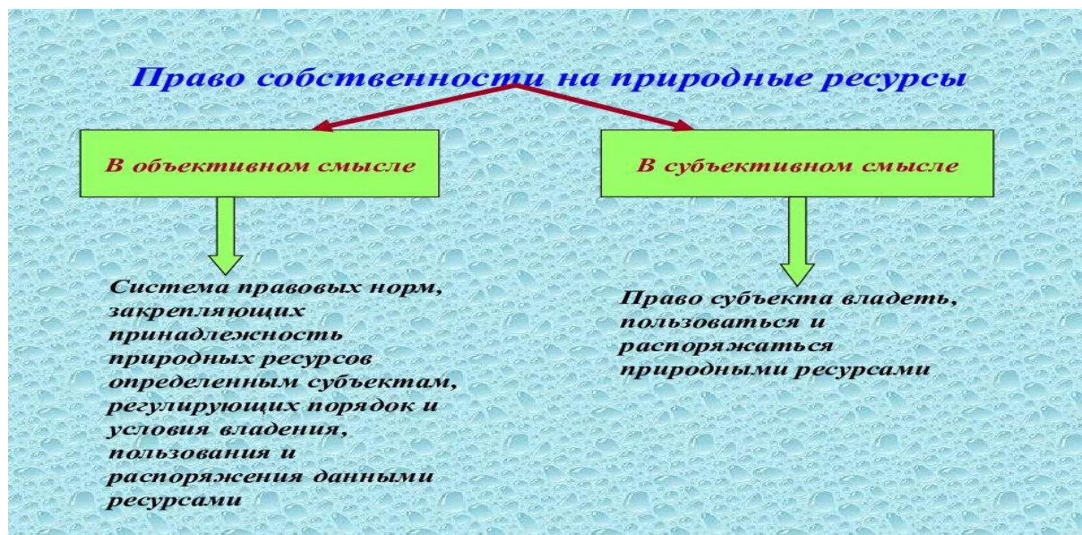
Рисунок 3.1 – Виды собственности на природные ресурсы