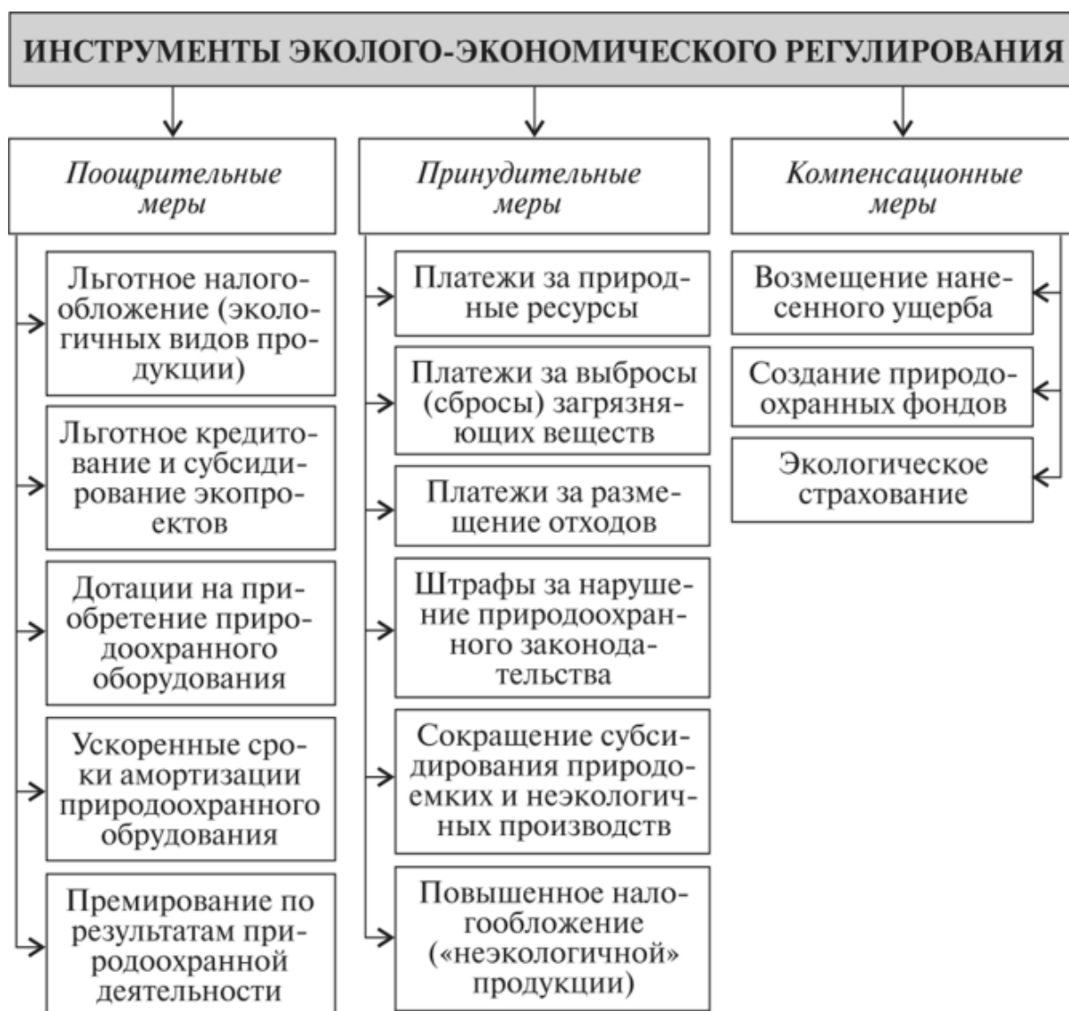
Рисунок 4.3 – Меры государственного регулирования природопользования

Лицензия на комплексное природопользование представляет собой разрешение, которое выдается природопользователю специально уполномоченными на то органами РФ в области охраны окружающей среды [10]. Лицензия выдается на каждый вид лицензируемой деятельности Федеральным законом от 8 августа 2001 г. № 128–ФЗ «О лицензировании отдельных видов деятельности». Передача лицензии другому юридическому или физическому лицу запрещена.