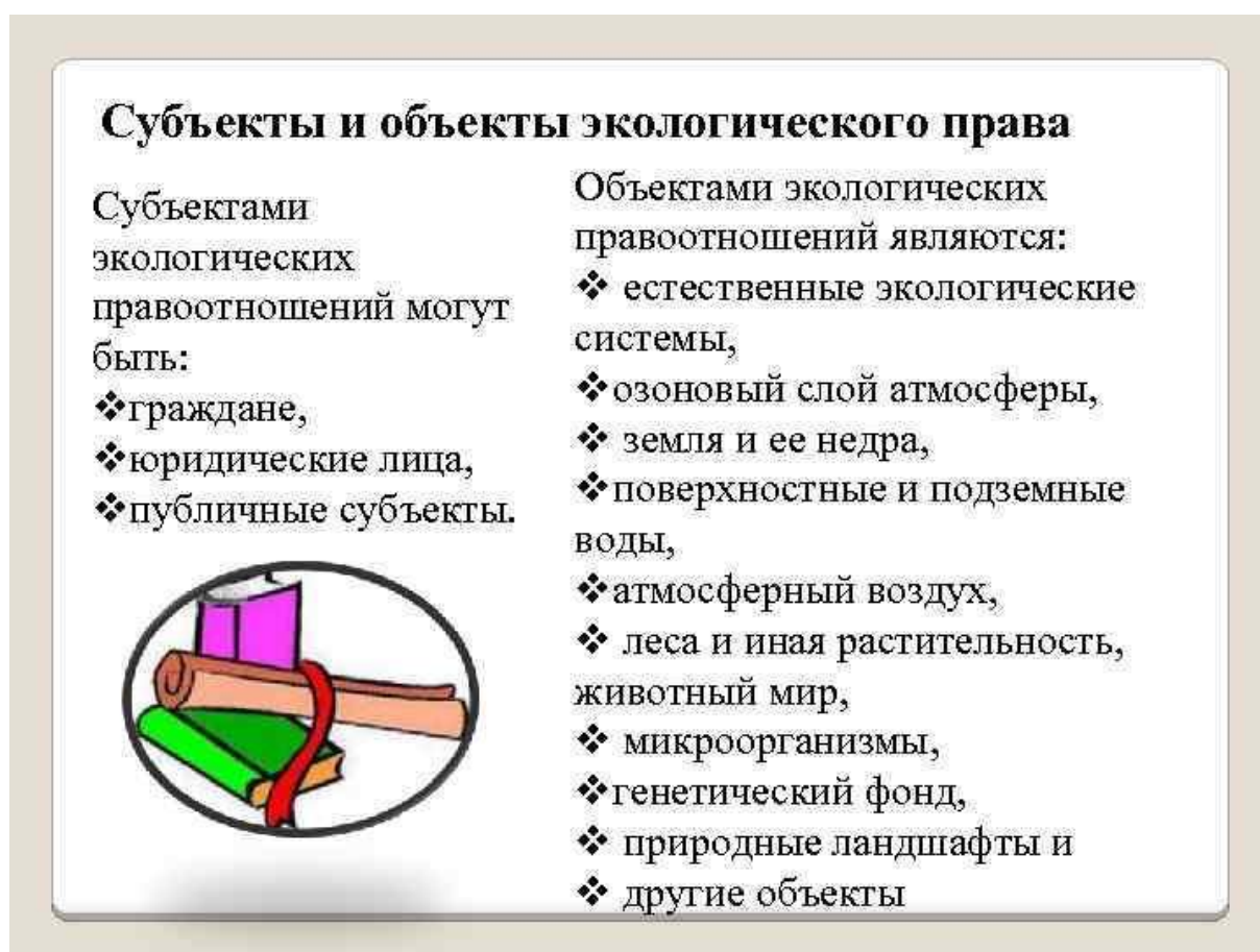
Рисунок 6.1 – Понятие объектов и субъектов экологических правоотношений

Экологические правонарушения имеют определенную структуру, позволяющую верно квалифицировать содеянное (рисунок 6.1).