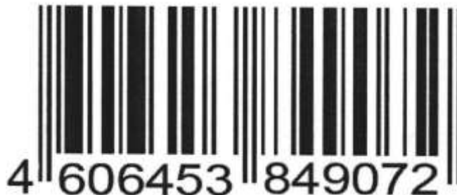
Рисунок 1 – Штрих код

Определение подлинности товара по штрих-коду международного стандарта