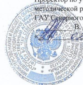
ГРАФИК промежуточной аттестации студентов 2 курса (4 семестр) направления подготовки «Агроинженерия» магистерская программа «Энергообеспечение предприятий» ИТИ в 2023-2024 учебном году. Экзаменационная сессия с 28.03.2025 г. по 29.03.2025 г.