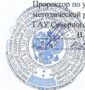
ГРАФИК промежуточной аттестации студентов 1 курса (2 семестр) направления подготовки «Агроинженерия» магистерская программа «Цифровизация технических систем в агроинженерии» ИТИ в 2024-2025 учебном году. Экзаменационная сессия с 11.04.25 г. по 12.04.2025г.