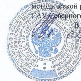
ГРАФИК промежуточной аттестации студентов 1 курса (2 семестр) направления подготовки «Агроинженерия» магистерская программа «Энергообеспечение предприятий» ИТИ в 2024-2025 учебном году. Экзаменационная сессия с 11.04.2025 г. по 12.04.2025 г.