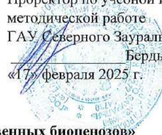
ГРАФИК промежуточной аттестации студентов 1 курса (2 семестр) направления 06.04.01 Биология магистерская программа « Управление ресурсами животных естественных биоценозов » АТИ в 2024-2025 учебном году зачётно-экзаменационная сессия с 11 апреля по 23 апреля 2025 г.