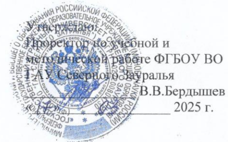
ГРАФИК промежуточной аттестации студентов 4 курса (8 семестр) направления подготовки « Продукты питания из растительного сырья » Профиль « Технология хлеба, кондитерских и макаронных изделий » ИТИ в 2024-2025 учебном году. Экзаменационная сессия с 06.05.2025г. по 07.05.2025г.