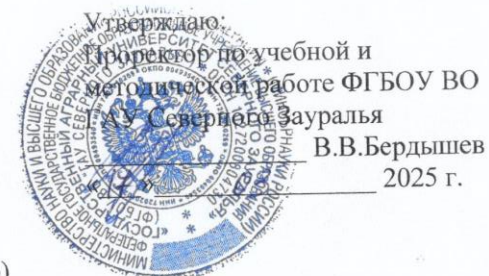
ГРАФИК промежуточной аттестации студентов 3 курса (6 семестр) направления подготовки «Агроинженерия» профиль «Электрооборудование и электротехнологии АПК» ИТИ в 2024-2025 учебном году. Экзаменационная сессия с 29.04.25г. по 07.05.2025 г.