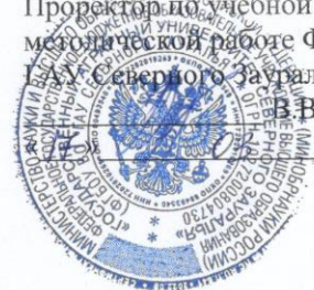
ГРАФИК промежуточной аттестации студентов 4 курса (8 семестр) направления подготовки «Агроинженерия» профиль «Электрооборудование и электротехнологии АПК» ИТИ в 2024-2025 учебном году. Экзаменационная сессия с 05.05.2025г. по 07.05.2025 г.