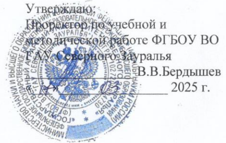
ГРАФИК промежуточной аттестации студентов 4 курса (8 семестр) направления подготовки «Агроинженерия» Профиль «Технический сервис в АПК» ИТИ в 2024-2025 учебном году. Экзаменационная сессия с 06.05.2025г. по 07.05.2025 г.