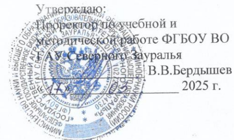
ГРАФИК промежуточной аттестации студентов 3 курса (6 семестр) направления подготовки «Агроинженерия» Профиль «Технические системы в агробизнесе» ИТИ в 2024-2025 учебном году. Экзаменационная сессия с 29.04.25г. по 07.05.2025 г.