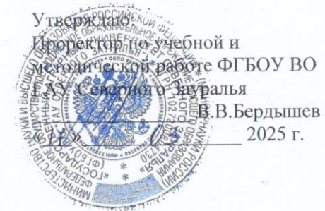
ГРАФИК промежуточной аттестации студентов 4 курса (8 семестр) направления подготовки «Лесное дело» Профиль «Лесное хозяйство» ИТИ в 2024-2025 учебном году. Экзаменационная сессия с 06.05.2025 г. по 07.05.2025 г.