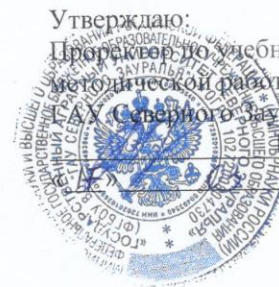
ГРАФИК промежуточной аттестации студентов 3 курса (6 семестр) направления подготовки «Агроинженерия» Профиль «Технический сервис в АПК» ИТИ в 2024-2025 учебном году. Экзаменационная сессия с 29.04.25г. по 07.05.2025 г.